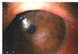
※角膜血管新生の例

害なども引き起こします。そして症状が急激に重症化した場合には、角膜混濁を生じて将来の視力に影響を与える重大なトラブルを引き起こしかねません。これらのトラブルを減らすためには①装着時間を守る②コンタクトレンズをかける③たま寝まない④使用期間の厳守⑤コンタクトレンズの洗浄・保存を正しく行なう⑥眼科専門医のいる病院で定期検診を行なう。この基本的なことを守ることが大切です。正しい知識をもつて正しく使いましょう。