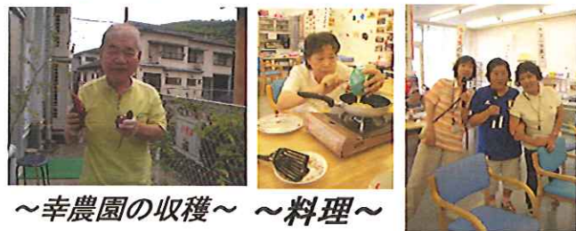
～幸農園の収穫～ ～料理～